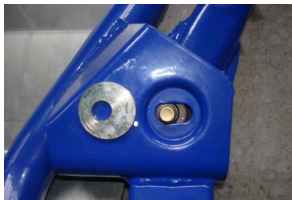
Схема регулировки развала и схождения остается серийной, схождение регулировкой длины тяг рулевого механизма, развал вращением эксцентрикового болта крепления кулака к стойке. Кастор регулируется подбором шайб из комплекта, причем верхняя и нижняя шайбы одной стороны должны быть одинаковы.

Завести переднюю часть рычага между горизонтальными полками кронштейна переднего, вставить болт вертикально. Задняя часть рычага устанавливается подобно серийному.