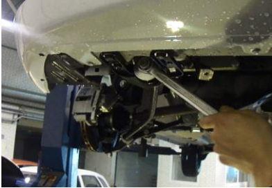
Открутить болты крепления передних кронштейнов