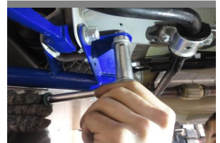
Отверстия заднего кронштейна совпадают с отверстиями кронштейна на кузове. После этого необходимо вставить рычаг в кронштейн и ввести болт сквозь кронштейн и рычаг так, чтобы шляпка болта была спереди! Наживите гайку. Справа следует аккуратно поддомкратить колесо, привод освободит доступ к кронштейну. После этого наживить и затянуть болт с шайбой (поставляется в комплекте) к штифту, установленному в базовом отверстии кузова.