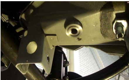
В базовое отверстие необходимо установить штифт.