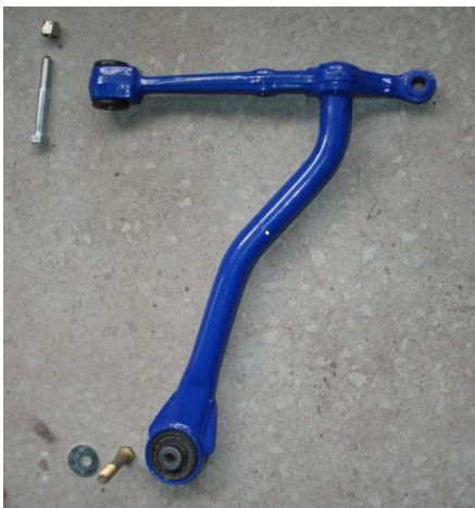
Завести переднюю часть рычага между горизонтальными полками кронштейна переднего, вставить болт вертикально. Задняя часть рычага устанавливается подобно серийному.