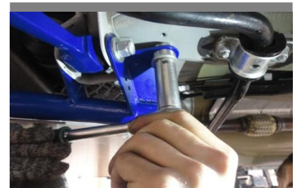
Отверстия заднего кронштейна совпадают с отверстиями кронштейна на кузове. После этого необходимо вставить рычаг в кронштейн и ввести болт сквозь кронштейн и рычаг так, чтобы шляпка болта была спереди! Наживите гайку. Справа следует аккуратно поддомкратить колесо, привод освободит доступ к кронштейну. После этого наживить и затянуть болт с шайбой (поставляется в комплекте) к штифту, установленному в базовом отверстии кузова.