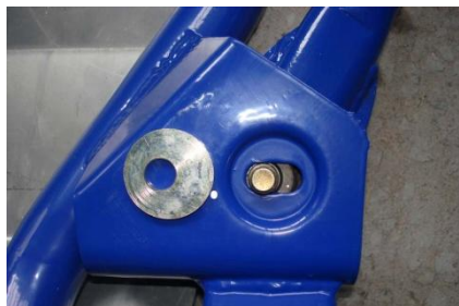
Схема регулировки развала и схождения остается серийной, схождение регулировкой длины тяг рулевого механизма, развал вращением эксцентрикового болта крепления кулака к стойке. Кастор регулируется подбором шайб из комплекта, причем верхняя и нижняя шайбы одной стороны должны быть одинаковы.