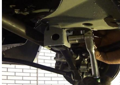
Демонтировать гайку и болт крепления рычага; демонтировать серийный рычаг.