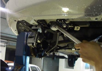
Открутить болты крепления передних кронштейнов