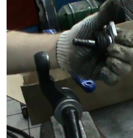
Отсоединить рычаг от шаровой опоры