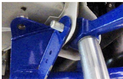
Сначала необходимо совместить отверстия задних охватываемых кронштейнов подрамника с отверстиями охватываемых кронштейнов. Штифты при этом должны войти в базовые отверстия. Для удобства можно поджать жесткий рычаг подрамника стойкой.